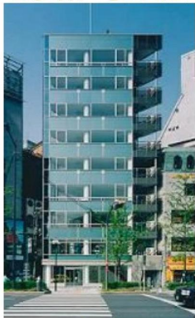
御堂筋からの外観図